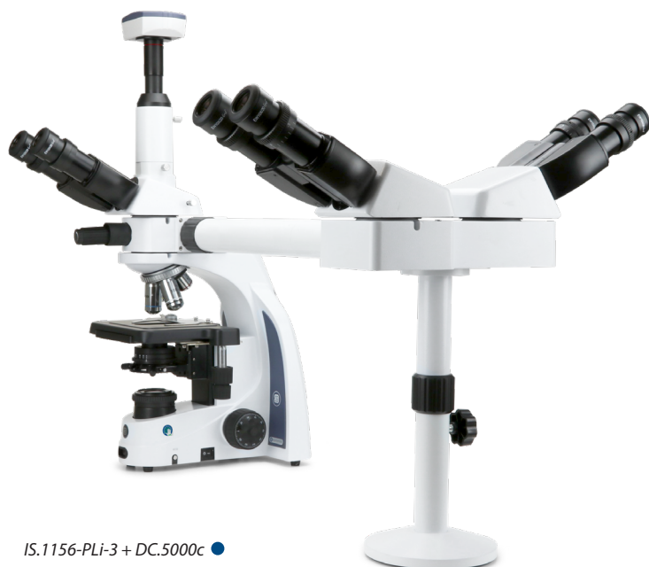
IS.1156-PLi-3 + DC.5000c ●